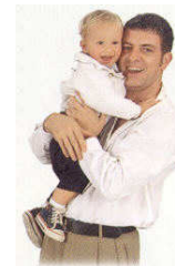
Ook kinderen hebben baat bij de Bicom Bioresonantie therapie. Vraag naar de mogelijkheden.

Een behandeling duurt doorgaans tussen de vijf en 30 minuten, is